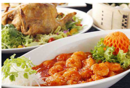
11/1-11/15 金土日祝日 中華フェア