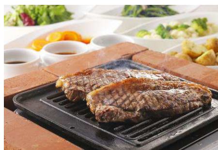
11/20-11/29 金土日祝日 ステーキ食べ放題