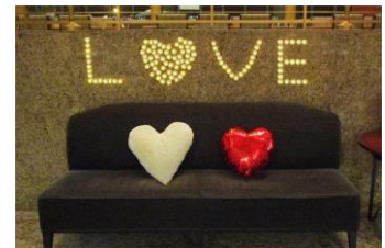
※テスト点灯時の様子